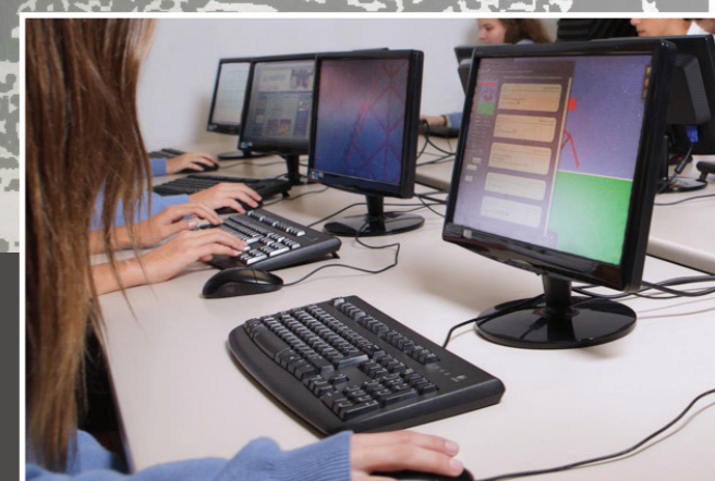
SALA D'ORDINADORS AMB ACCÉS A INTERNET