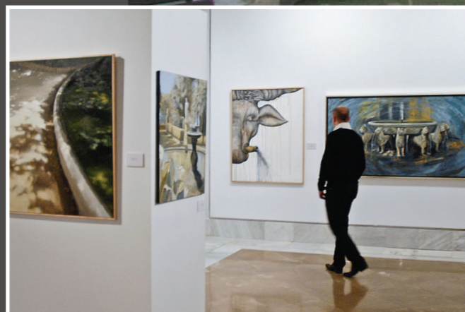
SALA POLIVALENT PER FER-HI EXPOSICIONS D'ARTISTES LOCALS, XERRADES, ETC.