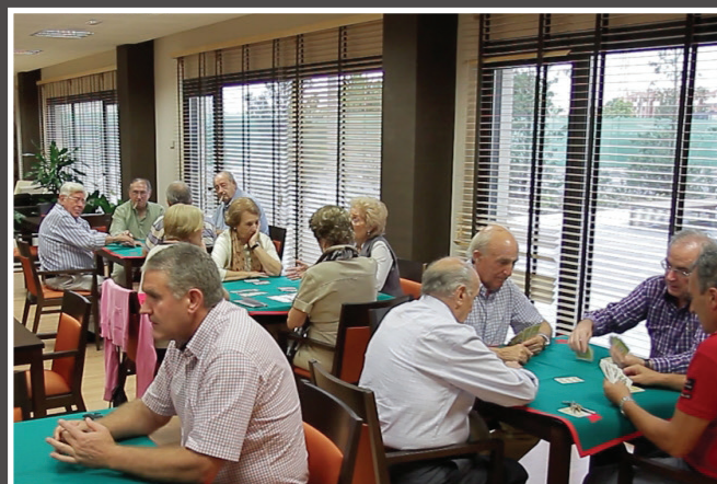
SALA D'USOS MÚLTIPLES PER FER ACTIVITATS DE GRUP COM: REUNIONS, TALLERS, JOCS (ESCACS, BILLAR, CARTES), ETC.