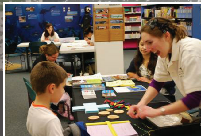
ZONA DE LECTURA, LUDOTECA I ESPAI PER A LES FAMÍLIES